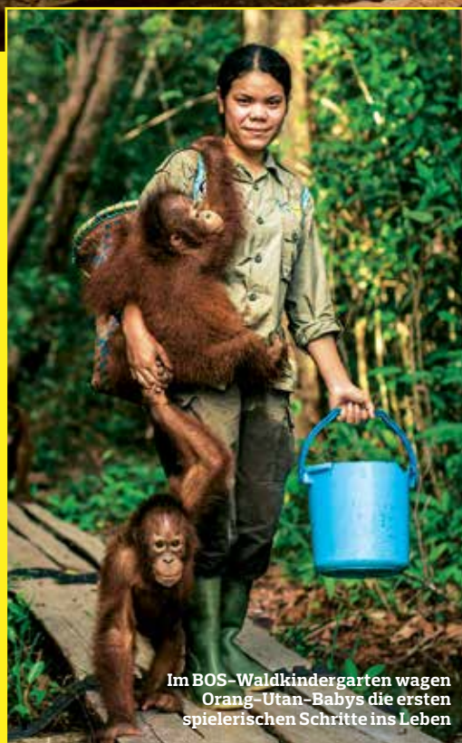
Im BOS-Waldkindergarten wagen Orang-Utan-Babys die ersten spielerischen Schritte ins Leben

Zerstörtes Paradies: Immer mehr Regenwaldflächen fallen Brand- rodung und Abholzung zum Opfer