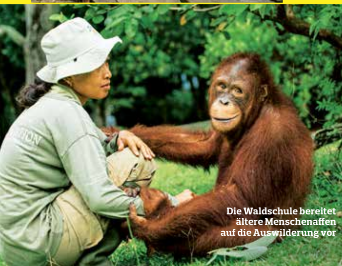
Die Waldschule bereitet ältere Menschenaffen auf die Auswilderung vor