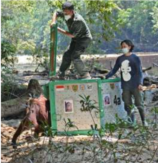
Der Moment des Abschieds braucht Jahre, um endlich da zu sein und ist viel zu schnell vorbei

währenddessen auf ein Minimum zu reduzieren, sollten die Tiere per Helikopter in das Schutzgebiet gebracht werden.