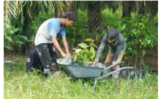
Über 8.000 Setzlinge sind bereits gepflanzt