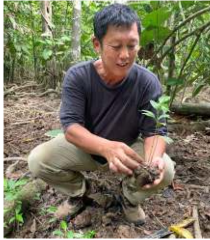
■ In Baumschulen werden die Setzlinge herangezogen, die sich an der ursprünglichen Flora Sabahs orientieren

Mit Ihrer wertvollen Unterstützung konnten wir unseren Einsatz in Sabah ausweiten. Wir forsten nun nicht mehr nur zwischen dem Tabin und dem Kulamba Reservat auf. Im Süden von Sabah liegt das Silabukan Schutzgebiet. Auch dieses ist eingekesselt von Ölpalmenplantagen und mit ihm unzählige Wildtiere. Hier haben wir bereits illegale Entwaldungen stoppen können und mit Aufforstungen begonnen, um das Gebiet zukünftig mit dem nördlicher gelegenen Tabin Nationalpark zu verbinden.