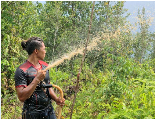
Unsere Feuerschutzteams patrouillieren durch das Torfmoor, um schnell eingreifen zu können

Denn in dem Gebiet – B1 genannt – hat sich die Natur bereits selbstständig erholen können. Bäume stehen hier schon meterhoch. Doch bricht hier in der Trockenzeit ein Waldbrand aus, ist alle Vegetation dem Feuertod geweiht. Deswegen müssen wir die Kanäle, die den Abschnitt umgeben und