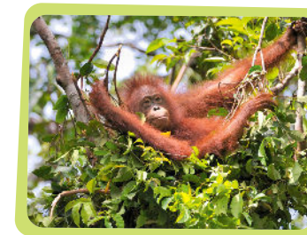
... ein Schlafnest zu bauen

Das macht BOS seit mittlerweile über 30 Jahren. In dieser Zeit konnten wir über 500 Orang-Utans zurück in die Wildnis schicken und ihnen so eine zweite Chance im Leben schenken.