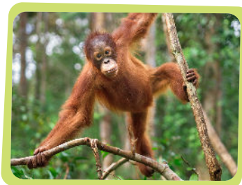
... auf hohe Bäume zu klettern