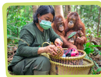
... wie man leckeres Futter sammelt