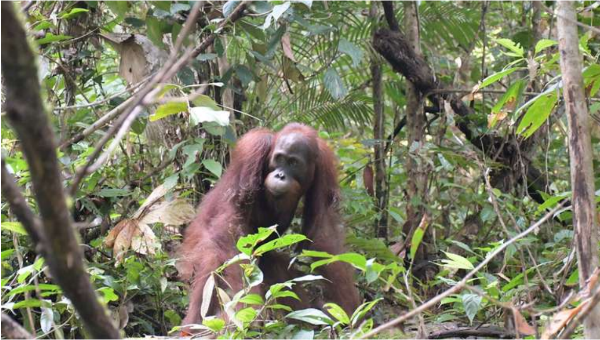
Orang-Utan Ben bei seiner Auswilderung im Bukit Baka Bukit Raya Nationalpark in Zentral-Kalimantan.

Und wie geht es Ben, Lima und Gonzales ein paar Tage nach ihrer Freilassung? Da sie als sehr intelligente und aktive Orang-Utans gelten, sind die BOS-Experten optimistisch, was ihre Zukunft betrifft. Alle drei begaben sich gleich auf Wanderschaft, kletterten auf Bäume, suchten und fanden Nahrung und begannen bei Dämmerung, ihr Schlafnest zu bauen. Beobachtungsteams sollen die drei jungen Wilden in den kommenden Wochen noch im Auge behalten - um sicherzugehen, dass sie sich in ihrem neuen Lebensraum gut zurechtfinden.