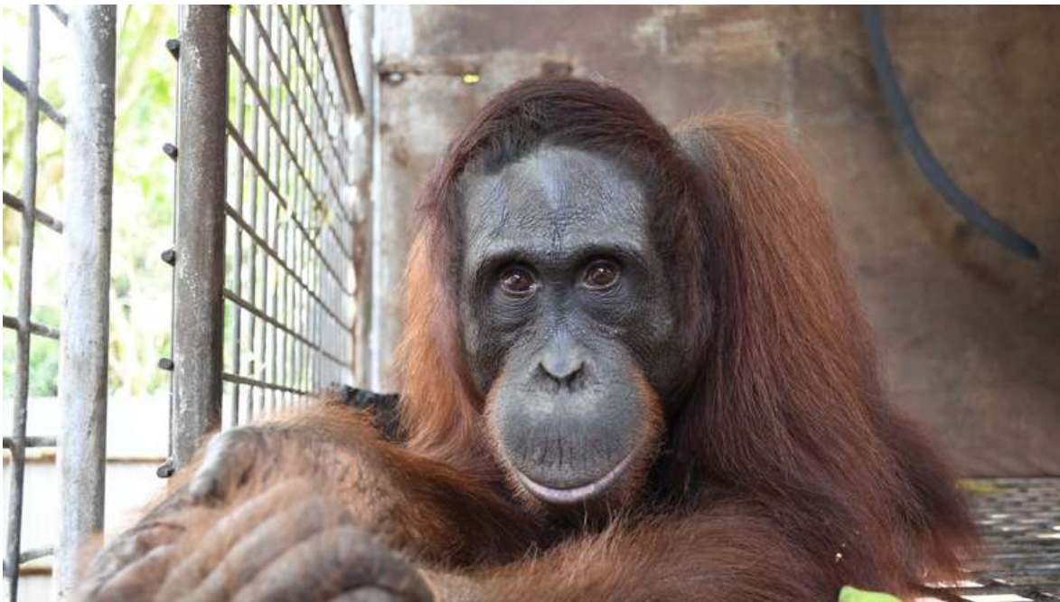
Orang-Utan Gonzales. BOS hat vor wenigen Tagen den 500. Menschenaffen im Nationalpark Bukit Baka Bukit Raya in Zentral-Kalimantan, dem indonesischen Teil von Borneo, ausgewildert.

Ziel von Orang-Utan-Rettungen ist es meist, die Tiere irgendwann im Regenwald auszuwildern. Aber vorher müssen sie jahrelang lernen, im Dschungel zu überleben.