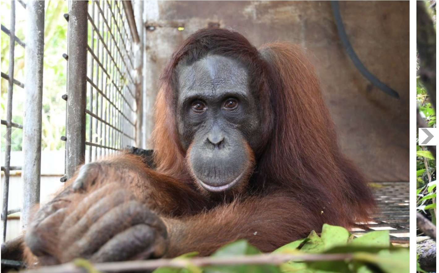
Orang-Utan Gonzales. BOS hat vor wenigen Tagen den 500. Menschenaffen im Nationalpark Bukit Baka Bukit Raya in Zentral-Kalimantan, dem indonesischen Teil von Borneo, ausgewildert.