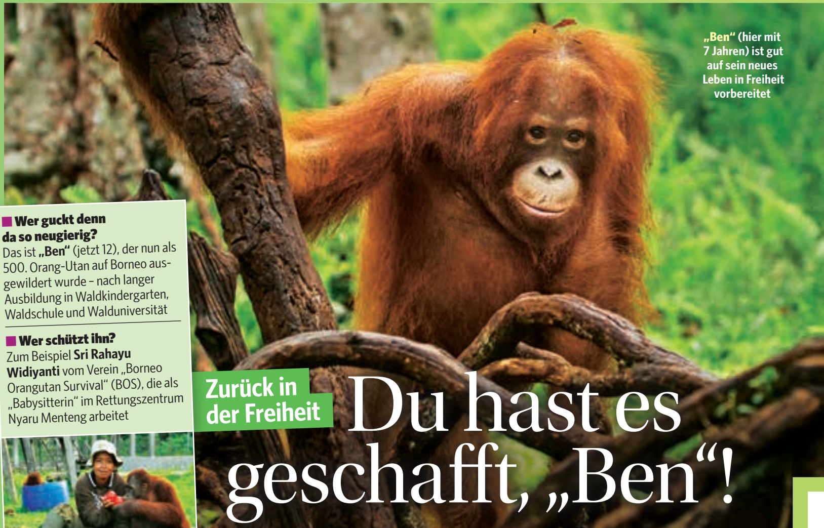
„Ben“ (hier mit 7 Jahren) ist gut auf sein neues Leben in Freiheit vorbereitet