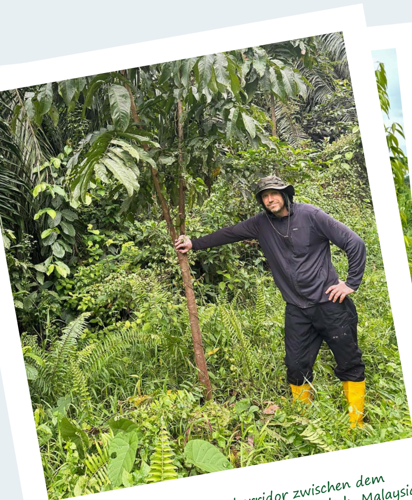
Dezember 2024, Wildtierkorridor zwischen dem Tabin- und dem Kulamba-Reservat, Sabah, Malaysia