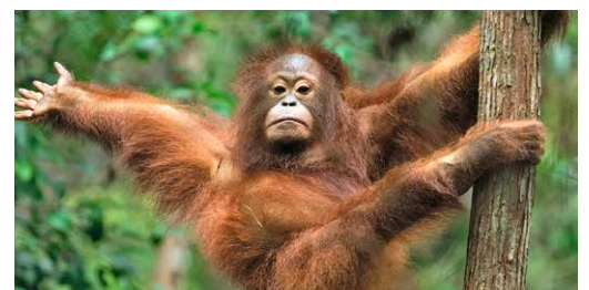
Mittlerweile ist Iqo eine echte Waldakrobatin

Onyer und Iqo haben sehr unterschiedliche Persönlichkeiten. Während Onyer gern die Aufmerksamkeit der anderen auf sich zieht, bleibt Iqo lieber für sich und feilt ehrgeizig an ihren schulischen Fähigkeiten. Beide befinden sich noch ganz am Anfang ihres Weges, wild zu werden. Es wird noch Jahre dauern, bis sie in die Freiheit zurückkehren können. Was sie jetzt brauchen, sind liebevolle Patinnen und Paten, die sie auf diesem Weg begleiten und unterstützen. Na, wie wär's? ■